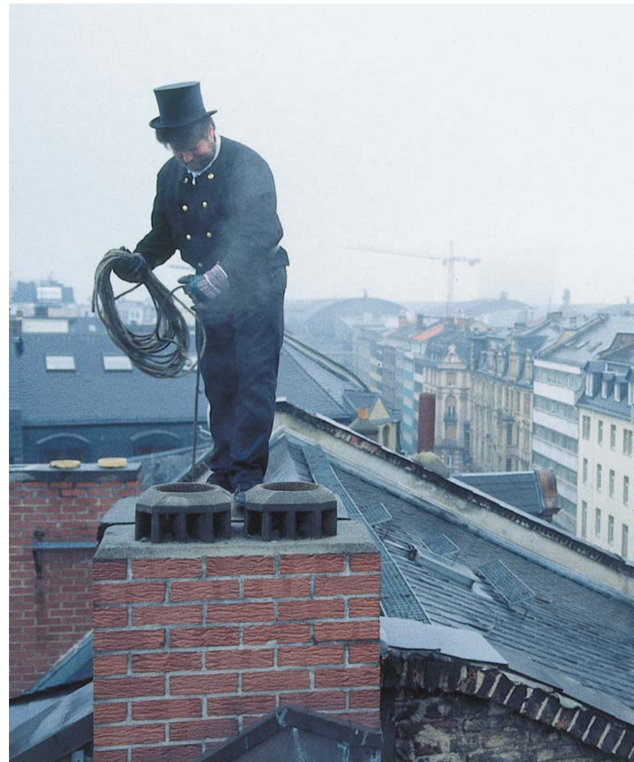
Rohr frei für Santa Claus

Richtig teuer wird es aber in jedem Fall, wenn bei den Messungen die Grenzwerte überschritten wurden und der handliche